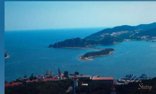
• Port Arthur