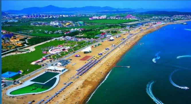
• Hi Coast of Golden Stone Beach