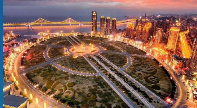
• Xinghai Square