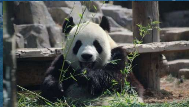
• Forest Zoo