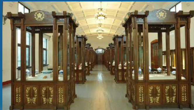
• Lushun Museum