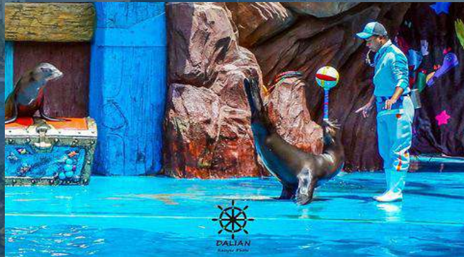
• Laohutan Ocean Park