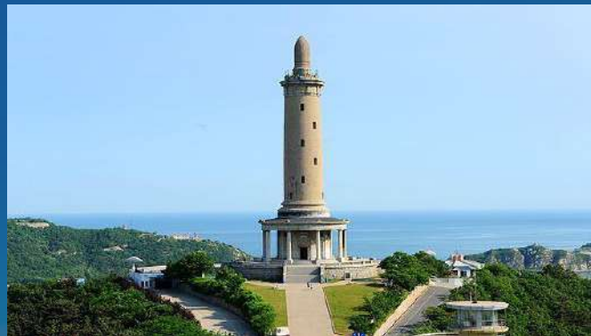
• Baiyu Mountain Pagoda