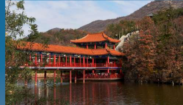
• Hengshan Temple