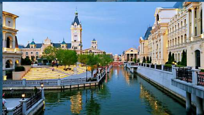
• Oriental Venice Water City