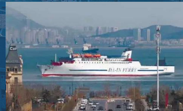
• 5th Gangdong Street