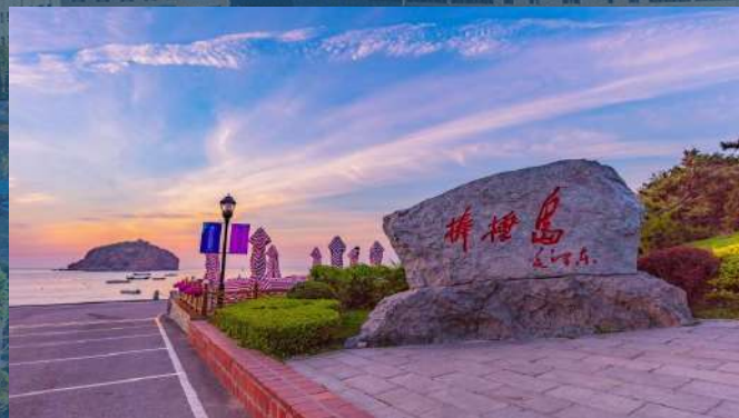
• Bangchui Island