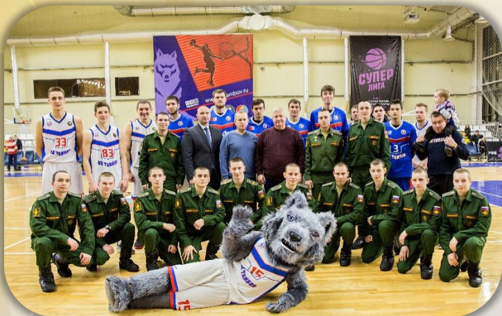
Посещение баскетбольного матча