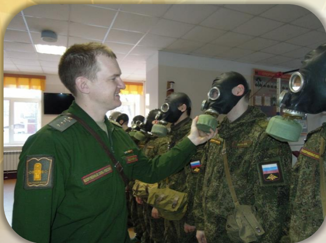
Занятие по РХБЗ