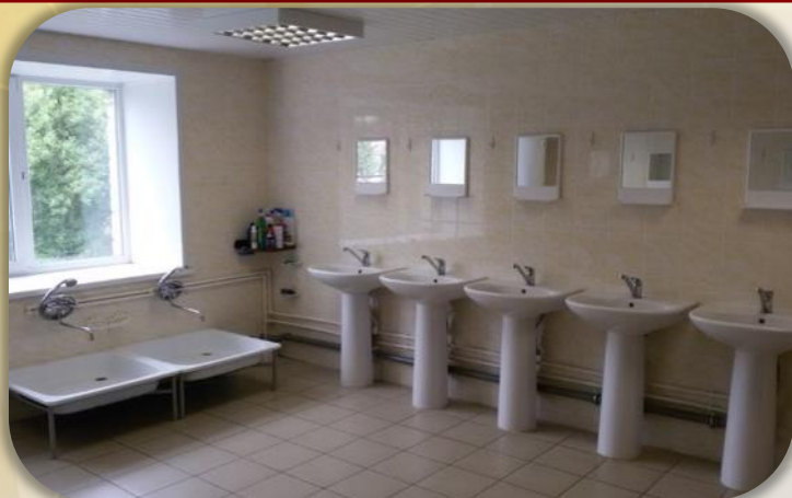
Комната для умывания