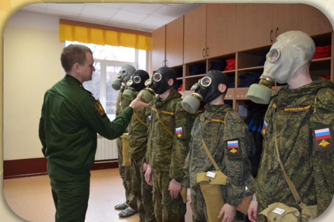
Подгонка средств индивидуальной защиты