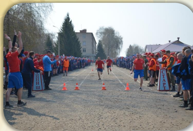
Занятие по физической подготовке