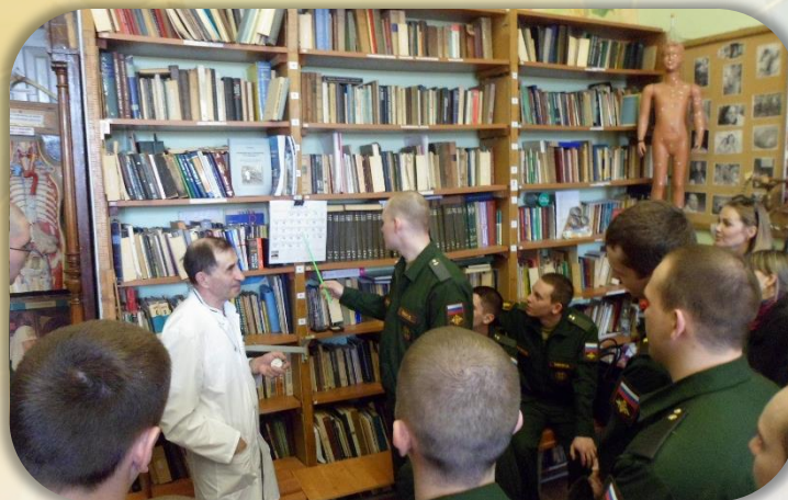
Поход в музей