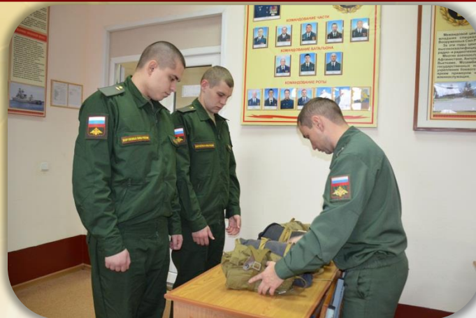
Обеспечение средствами индивидуальной защиты