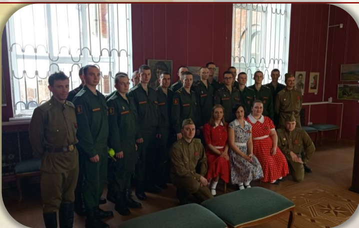
Посещение картинной галереи