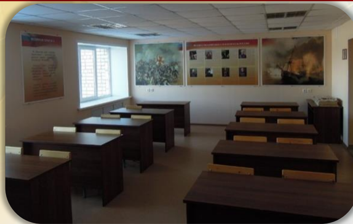
Комната информирования и досуга