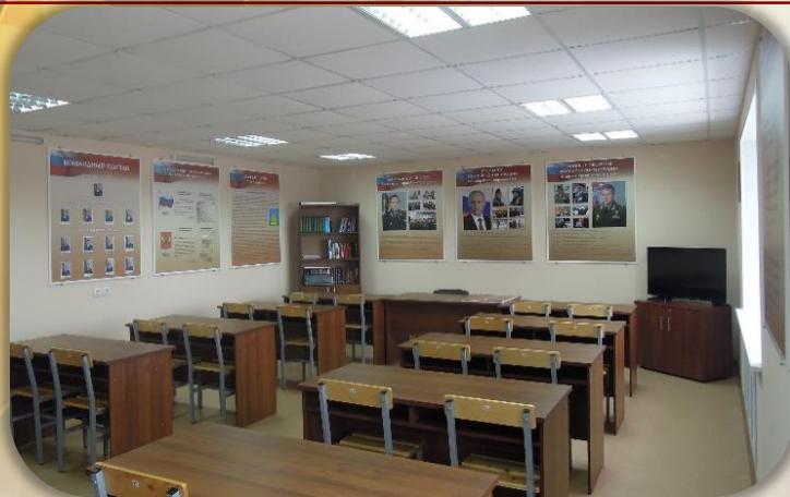
Комната информирования и досуга