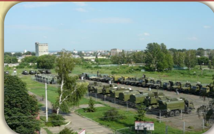
Полевой класс специальной техники РЭБ