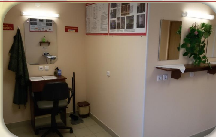
Комната бытового обслуживания