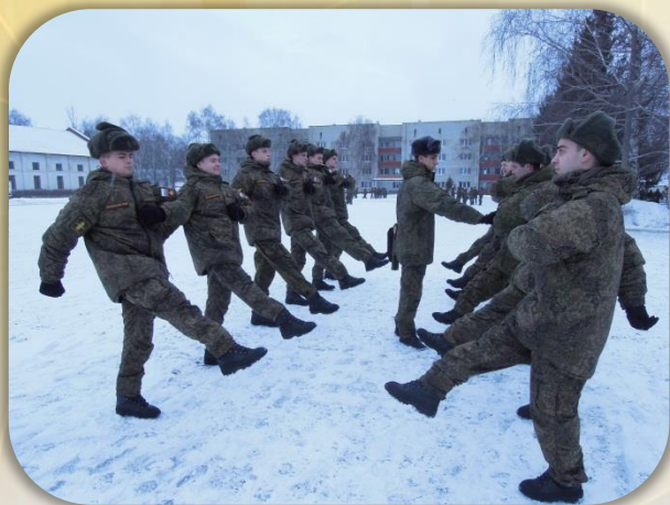
Занятие по строевой подготовке