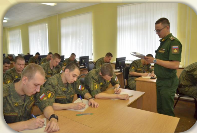
Занятие по военно-политической подготовке