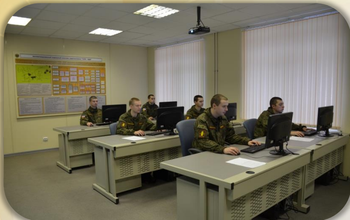
Класс проектирования обучающих систем