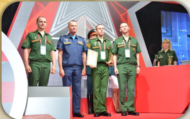
Награждение научной роты начальником ГУНИД