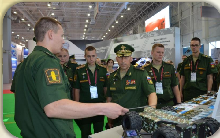
Представление экспонатов начальнику Войск РЭБ ВС РФ