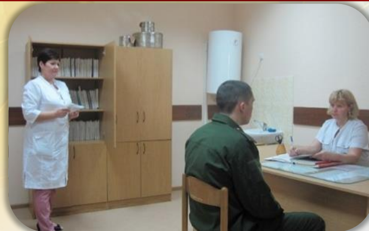
Регистратура, первичный осмотр