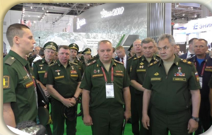
Представление экспонатов Министру обороны Российской Федерации