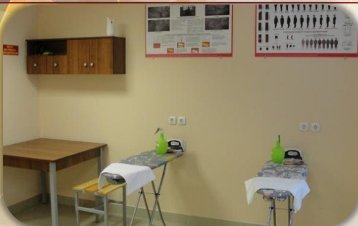
Комната бытового обслуживания