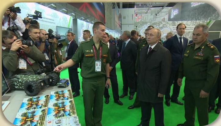
Представление экспонатов Президенту Российской Федерации