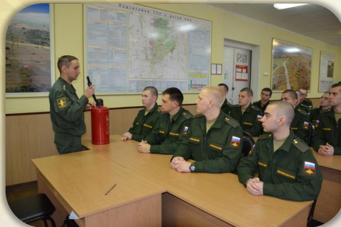
Инструктаж по технике безопасности