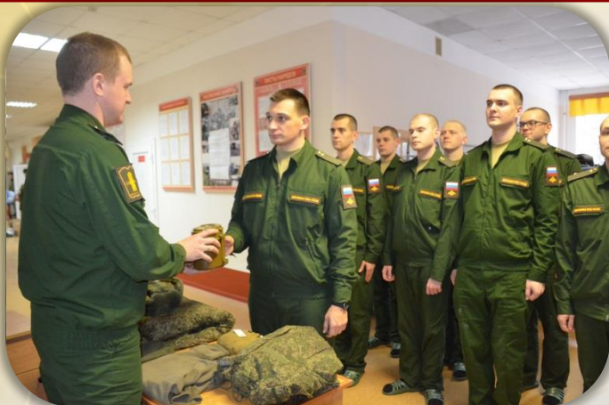
Получение вещевого имущества