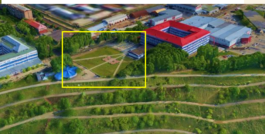
Вид участка с реки