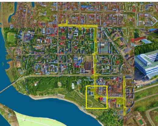
Участок: Ул. Вершинина – выход к реке Томь

Строим место своими руками с участием местных производителей Проводим мероприятие в созданном месте