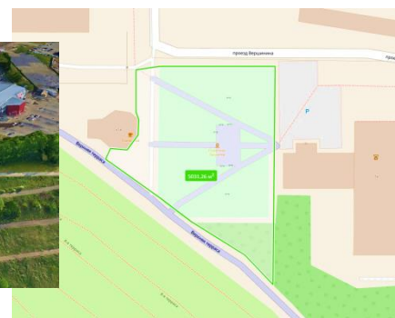
Площадь участка ок. 5000 кв.м

Участок в границах территории Живой лаборатории Томска